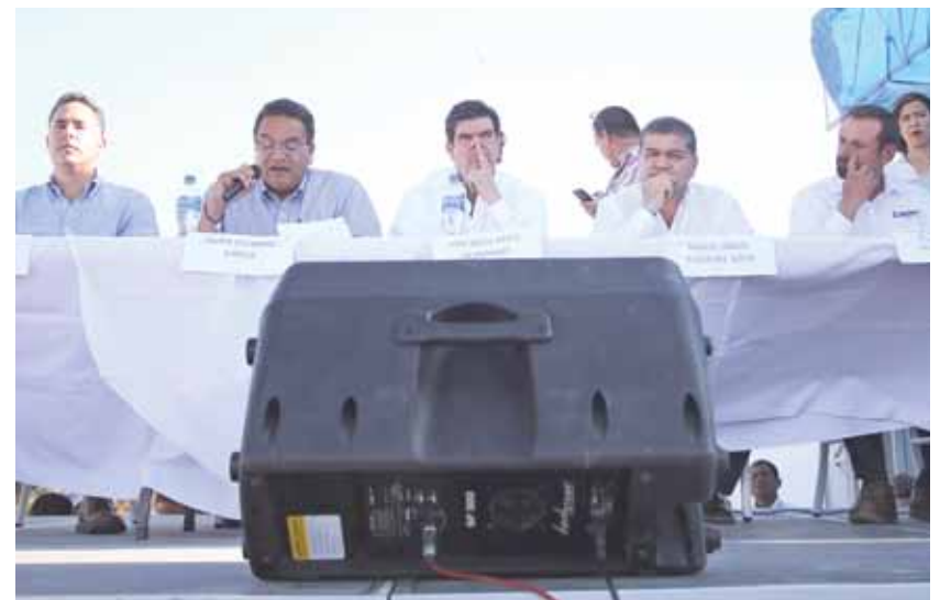
CINCO CANDIDATOS asumen compromisos con la sociedad civil.