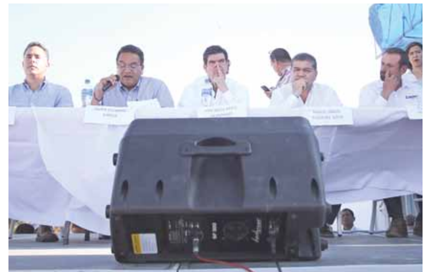
CINCO CANDIDATOS asumen compromisos con la sociedad civil.