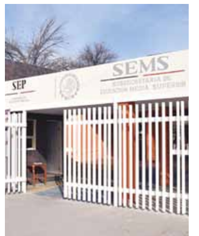
CONVOCAN A padres de familia a reunión urgente hoy a las 9:30 horas.

Además dijo que habrá presencia en el plantel, tanto física como de inteligencia, porque ya han ocurrido hechos violentos.