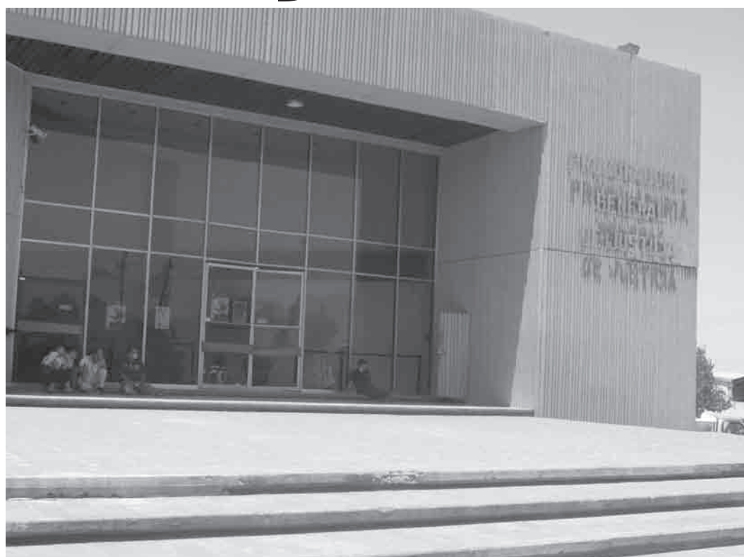
LAS AUTORIDADES Fiscales esperan que los afectados presenten el video y así tener alguna pista.

para que el sujeto, del cual no se tienen sus características, irrumpiera en el lugar después de forzar una de las puertas traseras sin ningún problema.