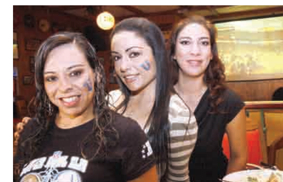
GRUPOS DE AMIGOS se reunieron en establecimientos en donde transmitieron el Supertazón XLIV.

La asistencia de familias completas, parejas, amigos, fue lo que se pudo observar en los bares, quienes mientras veían el partido, disfrutaron de una deliciosa comida y de un buen trago para acompañar el evento deportivo.