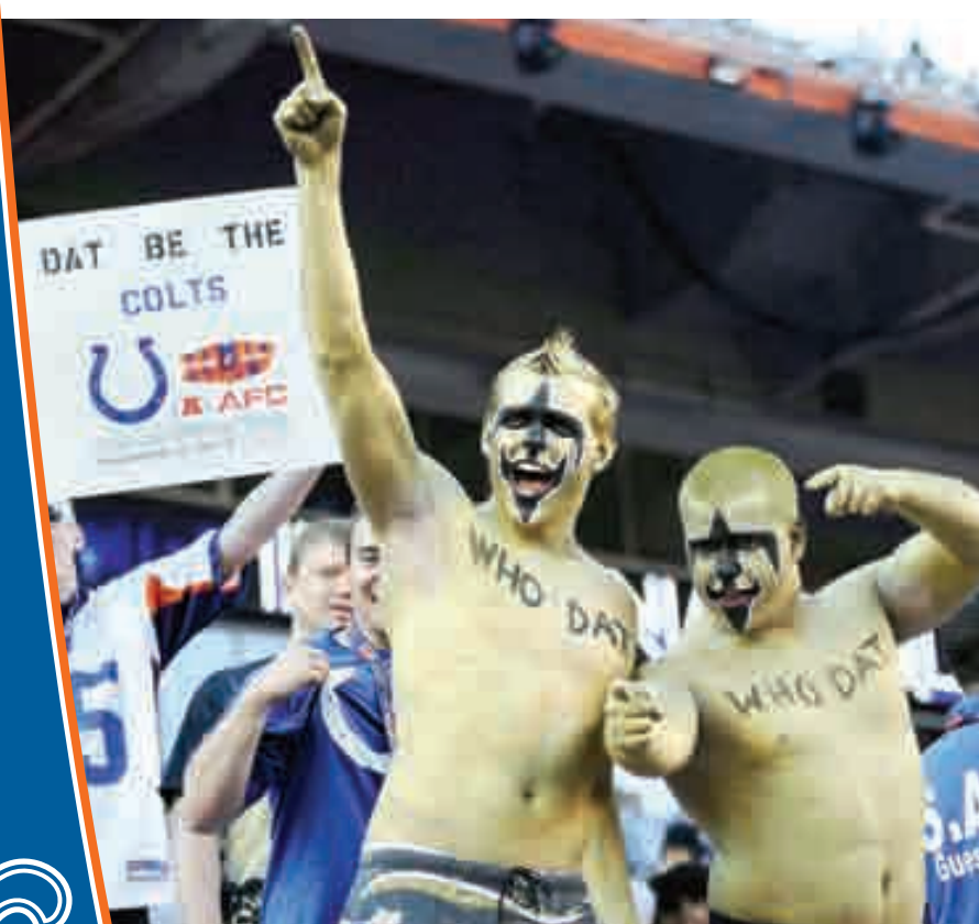
LOS SEGUIDORES de Santos de Nueva Orleáns se llevaron el juego en las tribunas con sus "diseños".

Sin embargo, los hombres y mujeres de jersey azul y blanco no se quedaron atrás, al pasear por los accesos del inmueble de la Florida a los seres humanos más estrafalarios, que tenían pintadas en su cabeza los colores de los Potros y el nombre de Peyton Manning.