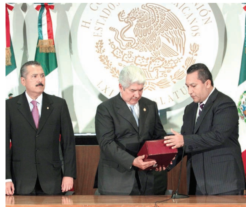
EL SECRETARIO de Gobernación entregó al Poder Legislativo el Informe de Felipe Calderón.

podieron ser sólo una distracción que se armó para que pudiera huir, como lo hizo, una de las personas que viajaban en la camioneta que era perseguida por la zona de Morones Prieto.