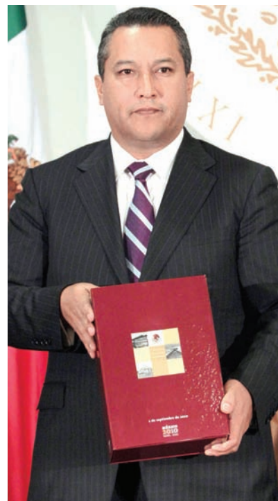
EN LOS cuadernillos se agregó una hoja con la información.

Subrayó que su detención se debe a los trabajos permanentes que realiza el Gobierno federal, y