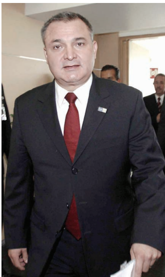
PIDE GARCÍA Luna reconocer el trabajo de la Policía Federal.