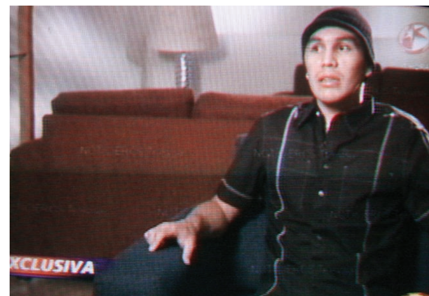
EL CAPO declaró a las autoridades haber escondido por tres meses al agresor de Cabañas.

en este caso, de las diversas operaciones de inteligencia que la Secretaría de Seguridad Pública (SSP) federal realizó desde 2009, con la finalidad de asegurar elementos de su estructura criminal y ubicar su paradero.