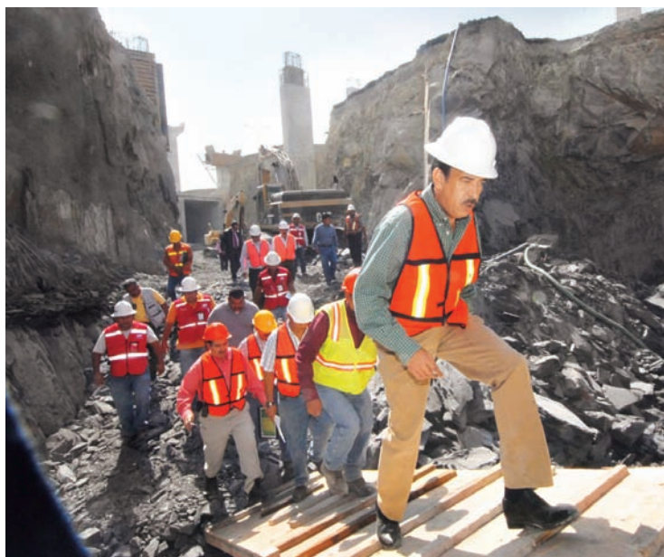
SE TRATA de la obra más importante de Coahuila en los últimos años.

El gobernador Moreira Valdés destacó que en la obra se generan