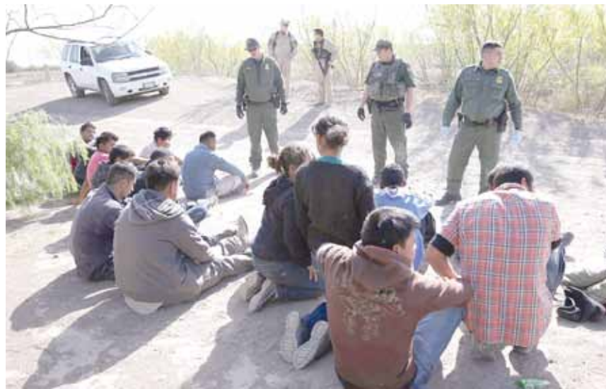
DETIENEN A grupo de 22 indocumentados y a "coyote" mexicano.

documentados que fue detectado en despoblado, los oficiales detectaron y arrestaron al responsable de haberlos guiado hasta ese lugar. El "coyote" resultó ser una persona de nacionalidad mexicana.