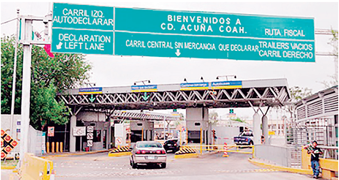
Altos funcionarios de la administración de Biden confirmaron que se levantarán las restricciones por la vía terrestre.

La administración Biden levantará las restricciones de viaje en las fronteras terrestres con Canadá y México a partir de noviembre para los viajeros completamente vacunados, reabriendo la puerta de Estados Unidos a los turistas y familias separadas que habían sido selladas del país durante la pandemia. Aquellos que proporcionen prueba de vacunación y estén buscando visitar a familiares o amigos o comprar en los Estados Unidos podrán ingresar el próximo mes, dijeron altos funcionarios de la administración, sólo unas semanas después de que el presidente Biden levantara una prohibición general similar sobre los extranjeros que buscan viajar al país. El levantamiento de la pro-