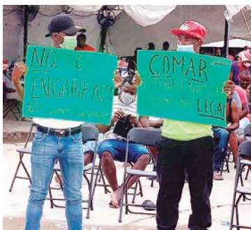
Expresaron que autoridades del INM intentaron engañar a migrantes haitianos haciéndolos firmar docu-

Solicitan documentación legal para poder trabajar en el país