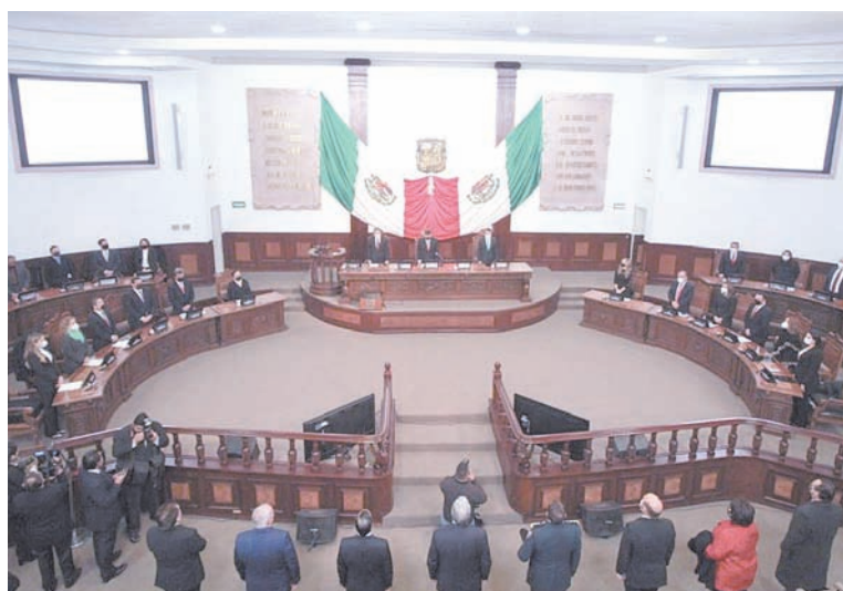
Se destaca que con esta reforma propuesta disminuirá el costo financiero fortaleciendo a la institución y al sistema de seguridad social estatal, impactando positivamente en las calificadoras de medición de riesgo.

@PeriodicoZocalo f Periodico Zócalo zocalopiedrasnegras