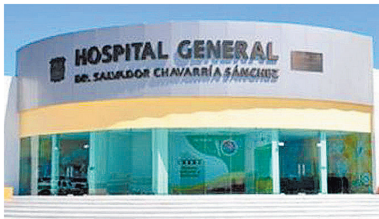
La adolescente dio a luz a un bebé varón en el Hospital General.