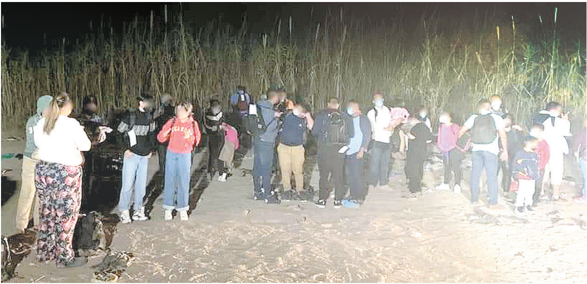
Localizan en despoblado a un grupo de 139 migrantes.

Este grupo de 139 migrantes estaba conformado en su mayoría por adultos solteros, son de Venezuela, Colombia, Cuba, India, Haití, Nicaragua