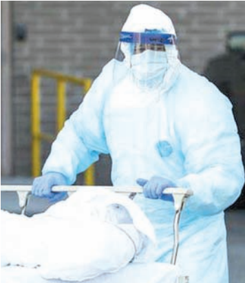
Arrebata el Covid-19 la vida a una jovencita de 18 años de edad.

Saltillo está en primer lugar en casos activos con 331, le sigue Torreón con 264, en tercer lugar Monclova con 96, en cuarto San Juan de Sabinas con 78 y en quinto Múzquiz con 66; esta frontera tiene 30 casos activos que le ubican en el lugar número 12, en este rubro.