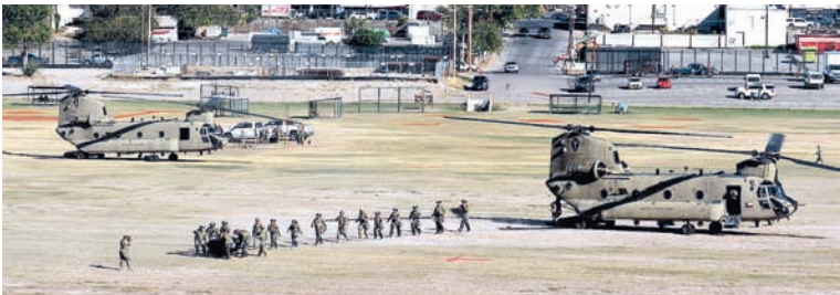
Las maniobras de las militares han sido constantes en la orilla del río Bravo en todo Eagle Pass.

Aunque la gerencia de la ciudad tiene informes de que la acción que simula la Guardia Nacional de Texas con el despliegue de helicópteros y efectivos militares en esta frontera sería humanitaria, si sucede al-