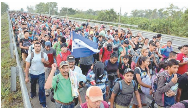
Se trabaja en conjunto para resolver la crisis migratoria.

pa tanto tratar este tema, que ya se puede decir y afirmar que ahora se ve un respaldo del Instituto Nacional de Migración para poder resolver situación de grupos pequeños de migrantes que a diario llegan a