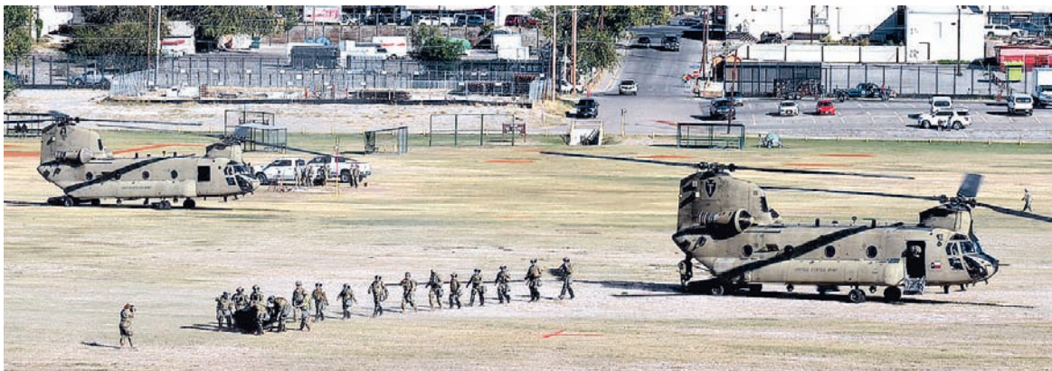
Las maniobras de los militares han sido constantes en la orilla del río Bravo en todo Eagle Pass.

En Eagle Pass se han desplegado más de 600 policías y elementos de la Guardia Nacional de Texas, así como más elementos de la Patrulla Fronteriza, esto luego de que la zona se consideró punto rojo por el alto promedio de indocumentados detenidos en el último mes que sumaron más de 15 mil a razón de más de 500 arrestos por día.