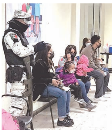
Piedras Negras aumentó el número de casos nuevos positivos a Covid-19.

De acuerdo al Reporte Coahuila del Plan Estatal de Prevención y Control Covid-19, de los 289 nuevos casos de coronavirus, Piedras Negras fue el de mayor número de contagios