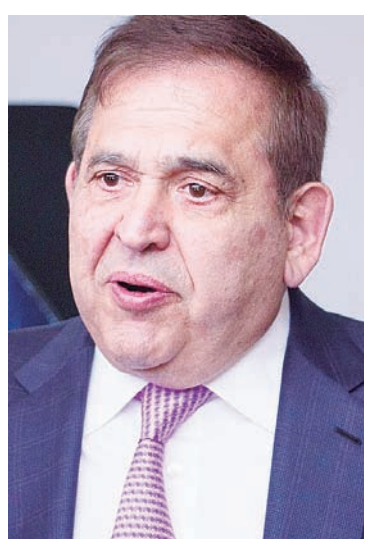
El pago de la reparación del daño se pactó en tres depósitos a una cuenta de una filial de Pemex.