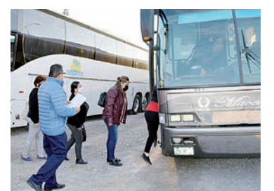
Será la próxima semana cuando vacunen a los docentes de Castaños.