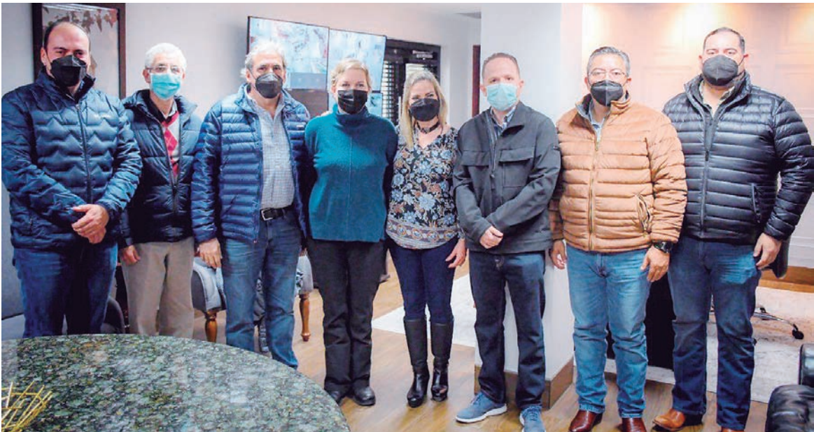
Coordina municipio regularización de autos chocolates con la Asociación de Agentes Aduanales.

Asimismo, detalló que debido a que el espacio de los agentes aduanales no es tan grande, se consiguió que se prestara un lugar enseguida y que el municipio a través del departamen-