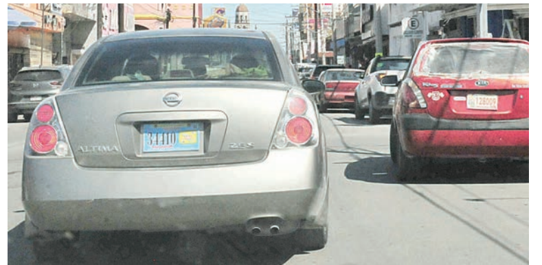
■ Alrededor de 89 mil vehículos se quedarán sin regularizar en la entidad.