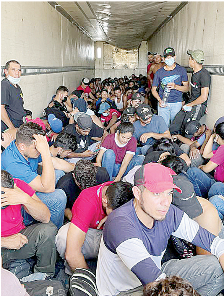
■ Un total de 127 migrantes fueron rescatados de la caja de un tráiler la tarde de este sábado, mientras otros 160 viajaban en autobuses.

de carga. Tras marcarle el alto al tráiler, se inició la revisión del armatoste tipo tractocamión marca Peterbilt color blanco, con placas 25-AH8X, donde se localizó a 127 migrantes, de los cuales 109 son hombres, 17 mujeres y una niña de 5 años de edad. El quinta rueda era conduci-