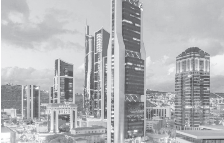
■ En Valle Oriente, en una oficina rentada por horas, se realiza la alquimia financiera para desaparecer los recursos.